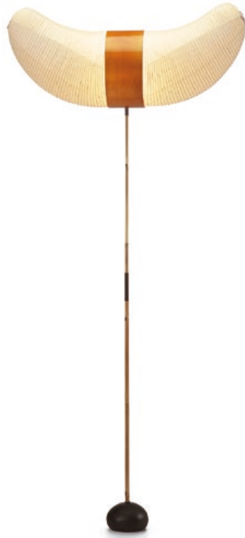
Akari BB3-33S 1700 x 750 x 750 mm Art. 201 536 01