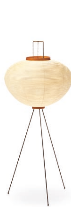
Akari 10A 1230 x 530 x 530 mm Art. 201 530 01

L'opera dell'artista e dello scultore nippo-americano Isamu Noguchi (1904–1988) è straordinariamente poliedrica: oltre alle sculture realizzò scenografie, mobili, lampade, interni, spazi pubblici e giardini. Come scultore il suo interesse non era rivolto soltanto alla materia e alla forma ma anche all'effetto nello spazio e alla configurazione degli ambienti. Desiderava che la sua arte avesse una funzione pratica e sociale. Lo stile scultoreo di Noguchi ebbe una notevole influenza sul linguaggio formale del design organico degli anni Cinquanta.