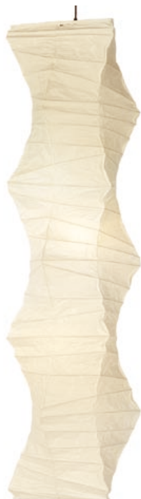
Akari 33N 1600 x 470 x 470 mm Art. 201 522 01