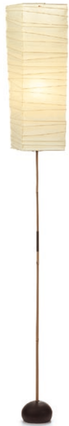
Akari BB3-70XN 1930 x 230 x 230 mm Art. 201 538 01