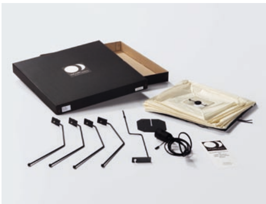
Akari Light Sculptures are supplied with a black connector cable (European plug, CEE 7 / 16) but without a bulb. We recommend the use of energy-saving lamps (E27 / 230 V fitting).

Todas las lámparas se fabrican artesanalmente y con especial mimo en la fabrica Ozeki en Gifu, toda una empresa familiar tradicional. Sobre el molde de madera creado por Noguchi se tensan primero las varillas de bambú que conformarán la estructura que las caracteriza. El papel shoji, hecho a mano a partir de la corteza de la morera, se corta en tiras, al igual que para los paraguas, y se fijan sobre las varillas de bambú. Después del secado se saca la estructura de madera y el paraguas se puede plegar. Para el envío o el almacenamiento, las Akari Light Sculptures se embalan en cajas planas diseñadas exclusivamente para las lámparas.