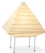
Akari 5 x 390 x 300 x 300 mm Art. 201 580 01