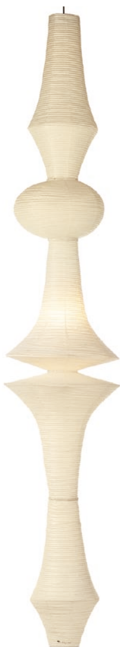
Akari E 2950 x 480 x 480 mm Art. 201 527 01