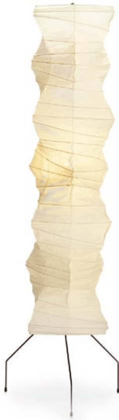
Akari UF4-33N 1900 x 470 x 470 mm Art. 201 559 01