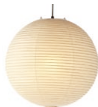
Akari 45A 450 x 450 x 450 mm Art. 201 508 01