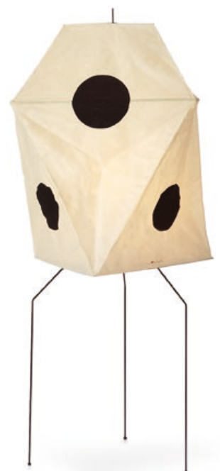
Akari UF3-Q white/black, 1450 x 560 x 560 mm Art. 201 557 01