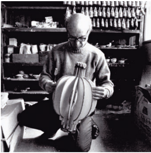
Noguchi in Gifu/Japan, 1978 Noguchi en Gifu/Japón, 1978 Noguchi a Gifu/Giappone, 1978