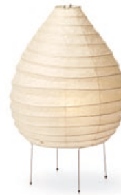
Akari 22N 630 x 420 x 420 mm Art. 201 575 01