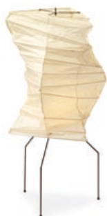
Akari UF2-33N 710 x 300 x 300 mm Art. 201 552 01