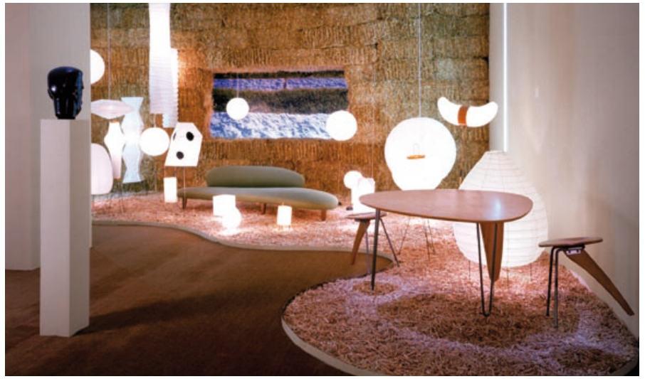
Vitra Design Museum exhibition "Isamu Noguchi" Exposición de Isamu Noguchi en el Vitra Design Museum Mostra di Isamu Noguchi presso il Museo Vitra Design