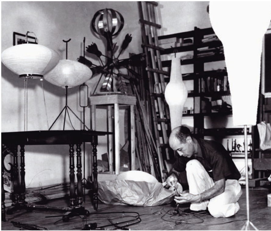
Noguchi with early Akari, 1950s Noguchi con las primeras Akari, años cincuenta. Noguchi con le prime lampade Akari, negli anni Cinquanta.