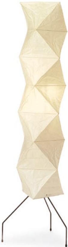
Akari UF4-L8 1880 x 410 x 410 mm Art. 201 562 01