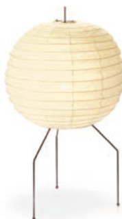
Akari UF2-FF 720 x 400 x 400 mm Art. 201 549 01