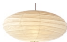
Akari 50EN 250 x 500 x 500 mm Art. 201 518 01