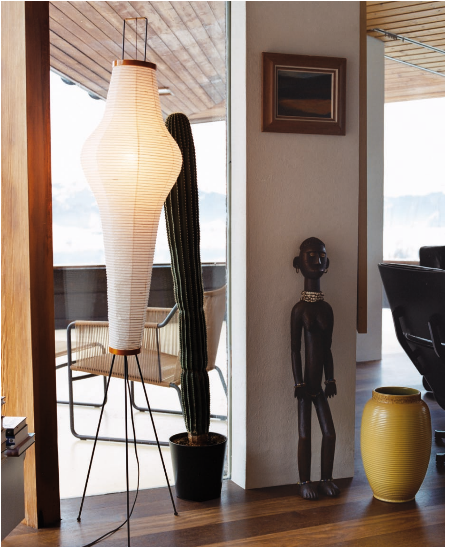
Photos: Ramesh Amruth, Isamu Noguchi Foundation, A. Sütterlin. © Vitra Design Museum 09/2008