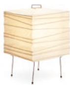
Akari 3X 380 x 230 x 230 mm Art. 201 578 01