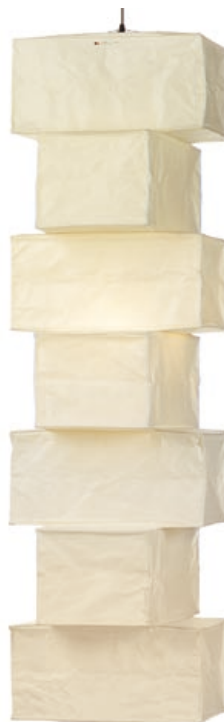
Akari 30P 1600 x 480 x 480 mm Art. 201 523 01