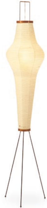
Akari 14A 1580 x 510 x 510 mm Art. 201 531 01