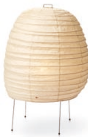
Akari 20N 630 x 420 x 420 mm Art. 201 574 01