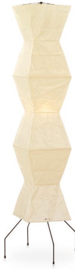
Akari UF4-L9 1930 x 360 x 360 mm Art. 201 563 01