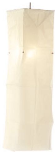
Akari L1 1090 x 280 x 280 mm Art. 201 502 01