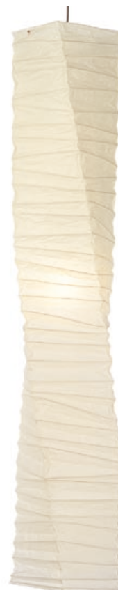
Akari J1 1880 x 250 x 250 mm Art. 201 501 01