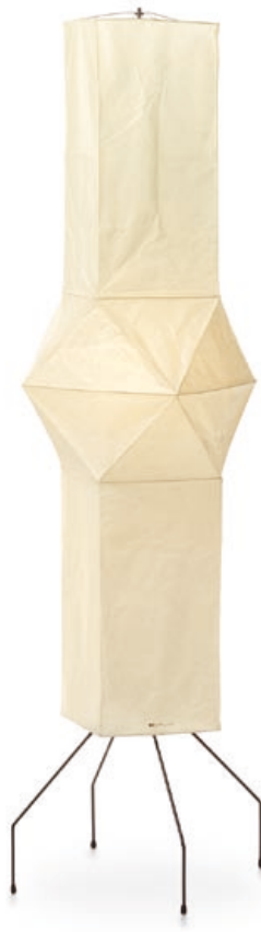
Akari UF4-L5 1900 x 610 x 610 mm Art. 201 561 01