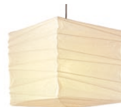
Akari 45X 430 x 430 x 430 mm Art. 201 525 01