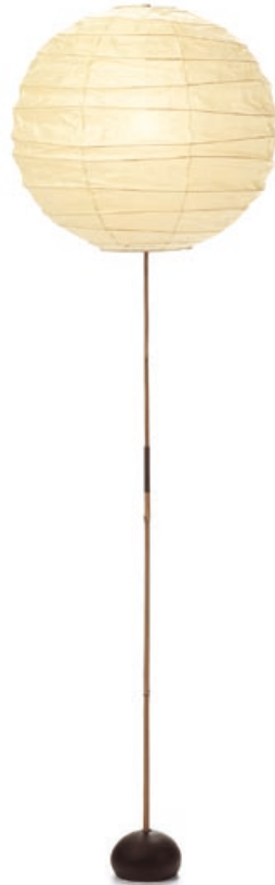
Akari BB3-55DD 1850 x 530 x 530 mm Art. 201 537 01