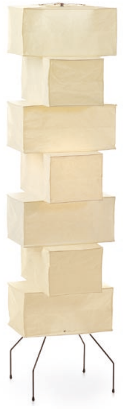
Akari UF4-L10 1930 x 480 x 480 mm Art. 201 560 01