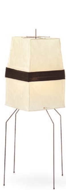
Akari UF3-H white/black, 1290 x 360 x 360 mm Art. 201 556 01