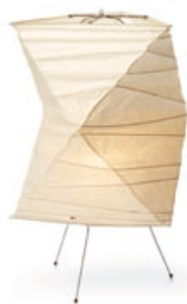
Akari 26N 610 x 350 x 350 mm Art. 201 576 01