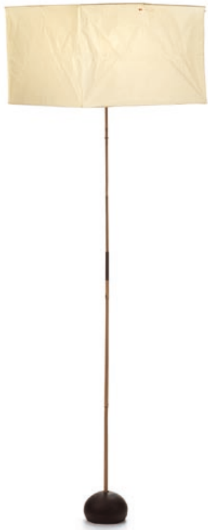
Akari BB3-X3 1680 x 460 x 460 mm Art. 201 539 01