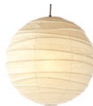
Akari 45D 430 x 450 x 450 mm Art. 201 514 01