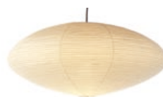
Akari 26A 250 x 450 x 450 mm Art. 201 507 01